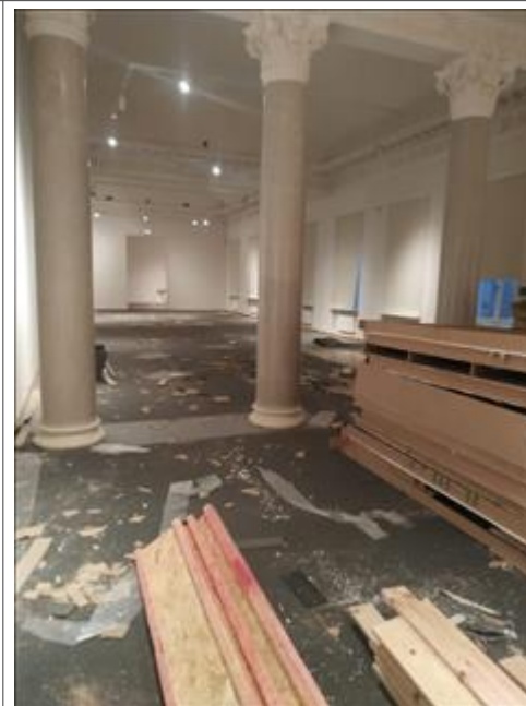
Работы по демонтажу выставки "Человек и война. Нерассказанная история" Тверская, 21