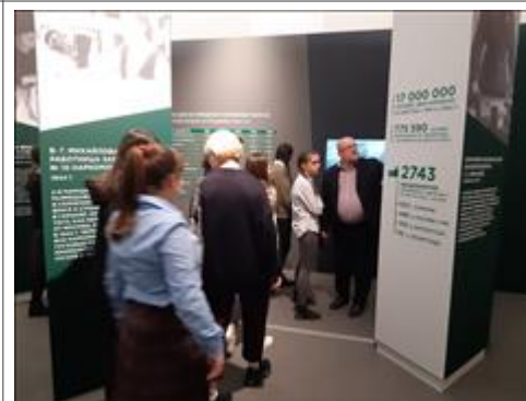
Экскурсии по выставке "Человек и война. Нерассказанная история" Тверская. 21