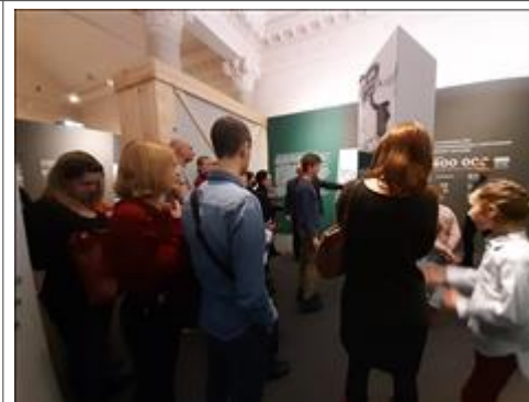
Экскурсии по выставке "Человек и война. Нерассказанная история" Тверская, 21