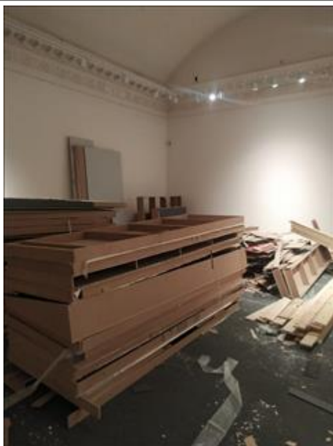
Работы по демонтажу выставки "Человек и война. Нерассказанная история" Тверская, 21