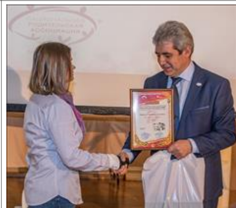
Церемония награждения ГЦМСИР, Тверская, 21

Количество публикаций за весь срок осуществления проекта