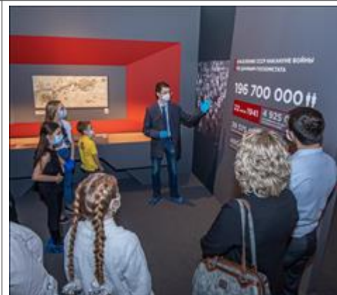
Экскурсия по выставке Экскурсия по выставке "Человек и война . Нерассказанная история"