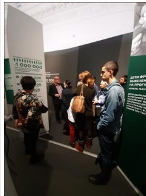
Экскурсии по выставке "Человек и война. Нерассказанная история" Тверская, 21