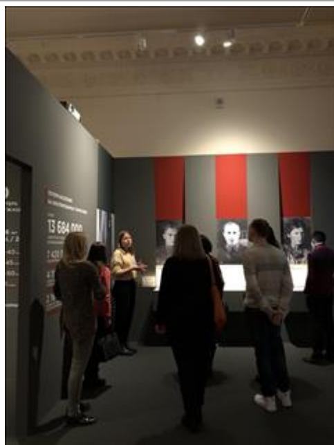
Экскурсии по выставке "Человек и война. Нерассказанная история" Тверская, 21