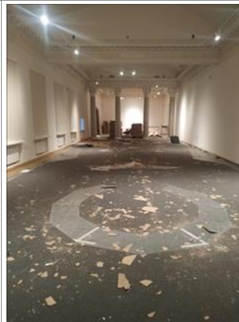
Работы по демонтажу выставки "Человек и война. Нерассказанная история" Тверская, 21

Мероприятие: Выставку по билетам, распространенным на безвозмездной основе посетили во время проведения мероприятий не менее 20 000 человек целевой аудитории, в том числе: экскурсионное обслуживание получили не менее 5250 посетителей выставки.