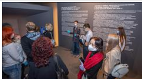
Экскурсия по выставке Экскурсия по выставке "Человек и война. Нерассказанная история"