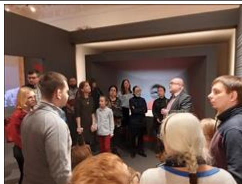
Экскурсии по выставке "Человек и война. Нерассказанная история" ГЦМСИР. Тверская, д.21