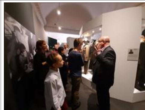
Экскурсии по выставке "Человек и война. Нерассказанная история" Тверская, 21