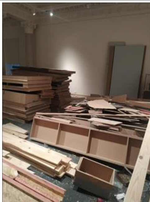
Работы по демонтажу выставки "Человек и война. Нерассказанная история" Тверская, 21