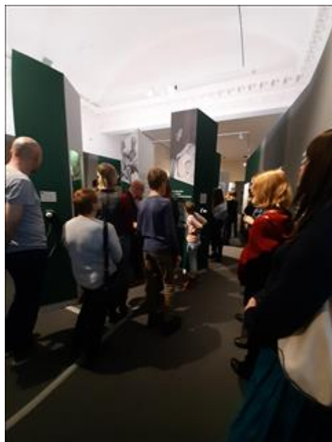
Экскурсии по выставке "Человек и война. Нерассказанная история" Тверская, 21