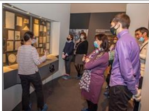
Экскурсия по выставке Экскурсия по выставке "Человек и война . Нерассказанная история"

Мероприятие: Подготовлены и проведены 350 тематических экскурсий