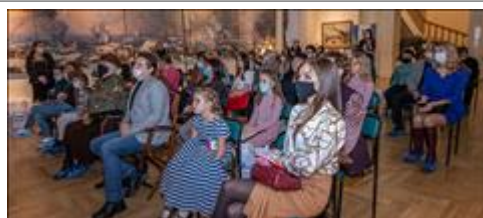
Церемония награждения победителей Церемония награждения