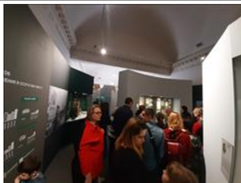
Экскурсии по выставке "Человек и война. Нерассказанная история" Тверская, 21